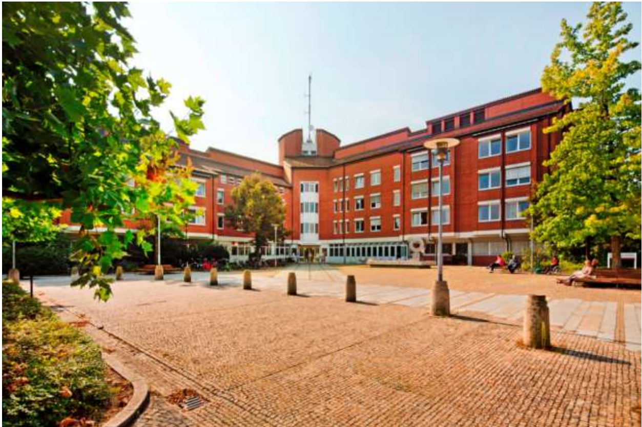
Kliniken Landkreis Diepholz gGmbH, Klinik Diepholz